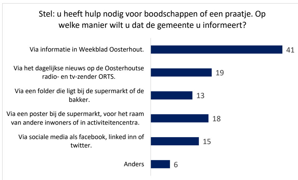
Figuur 2-4; Stel: u heeft hulp nodig voor boodschappen of een praatje. Op welke manier wilt u dat de gemeente u informeert?

Bij 'anders' wordt genoemd: Huis aan huis verspreiding of een brief vanuit de gemeente, want vooral ouderen zijn niet goed met sociale media. Zie figuur 2-4.