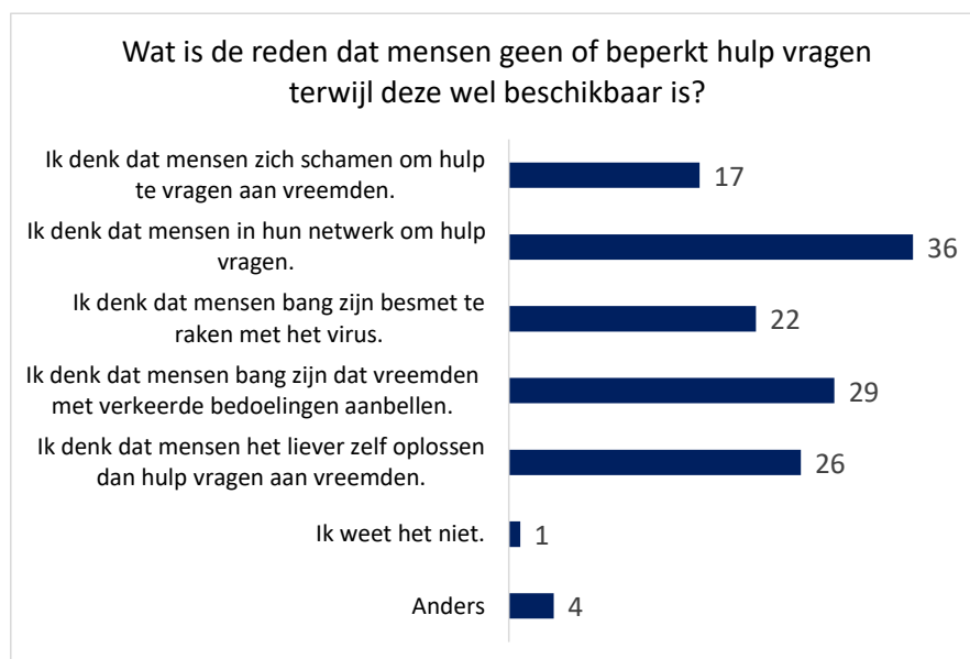
Figuur 2-5; Wat is de reden dat mensen geen of beperkt hulp aanvragen terwijl deze wel beschikbaar is?

Vraag 6: Kunt u één of meerdere vormen van hulp noemen die via allerlei media en door allerlei vrijwilligers wordt aangeboden?