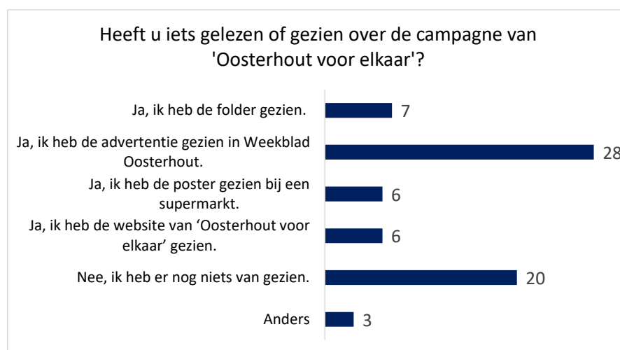
Figuur 2-1; Heeft u iets gelezen of gezien over de campagne van 'Oosterhout voor elkaar'?

28 van de 54 respondenten heeft de advertentie gezien in Weekblad Oosterhout. 20 respondenten heeft nog niets gezien van de campagne. 7 respondenten hebben de folder gezien en 6 hebben de raamposter gezien bij de supermarkt. Eveneens 6 respondenten zagen de website van 'Oosterhout voor elkaar'. Bij anders staat geen nadere uitleg. (Figuur 2-1.)